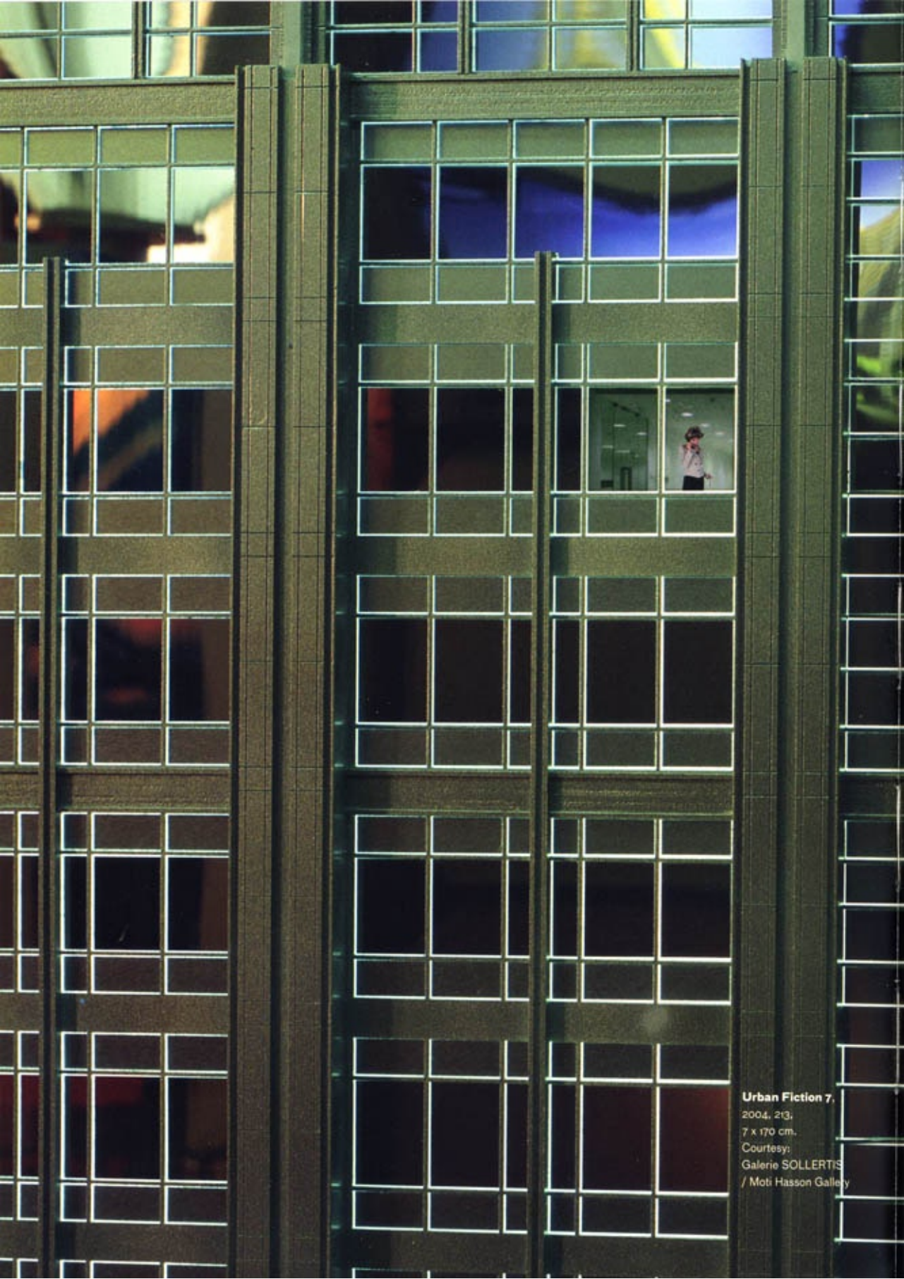
Urban Fiction 7, 2004, 213, 7 x 170 cm.