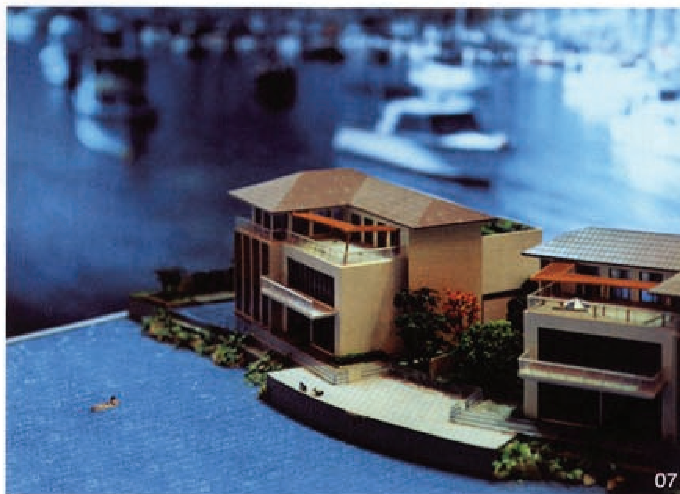
07 邢丹文 都市演绎 摄影 150X206cm 打印材质：EPSON 高质量亚光照片纸 270 克 2009

在当今中国，运用摄影作为表现手段显然已经成为一种时髦。而且，也确实有许多机灵的艺术家用准时机，在对于摄影一无所知的情况下因大胆运用摄影手段而一举成名。然而，邢丹文的摄影经历，从一开始就向我们证明，她是出于一种对于摄影本身的深厚兴趣与严肃的态度来展开自己的艺术实践的。她充分认识到了摄影所具有的丰富潜能，并且全身心地投入到开发摄影表现潜能的工作中去。从1989年起开始拿起照相机的邢丹文，在与她身处其中的中国当代社会现实展开对话的过程中，同时也与摄影这个现代视觉媒介展开了对话。随着中国的变化与发展，摄影以及影像在现实生活中的扮演的角色越来越多样化，也越来越复杂。这种复杂性与丰富性，也正好从她的艺术经历中得到印证。纵观邢丹文的艺术经历，可以发现，这几乎就是一个人与一种媒介在中国社会的发展变化中共同成长的历程。她以她的持续的、可靠的专业经历证明，人们可以从她的专业经历的轨迹，清楚地发现摄影这个现代性的媒介在一个当代艺术家手中如何获得当代意义。与此同时，摄影这个媒介在当代中国的生长与发育，也通过她的实践而具有了一种个案意义。她通过自己的实践，证明了摄影在当代中国的存在价值。而作为一个在国际舞台上非常活跃的艺术家用，她的摄影实践也一直在丰富着中国摄影在世界上的形象。