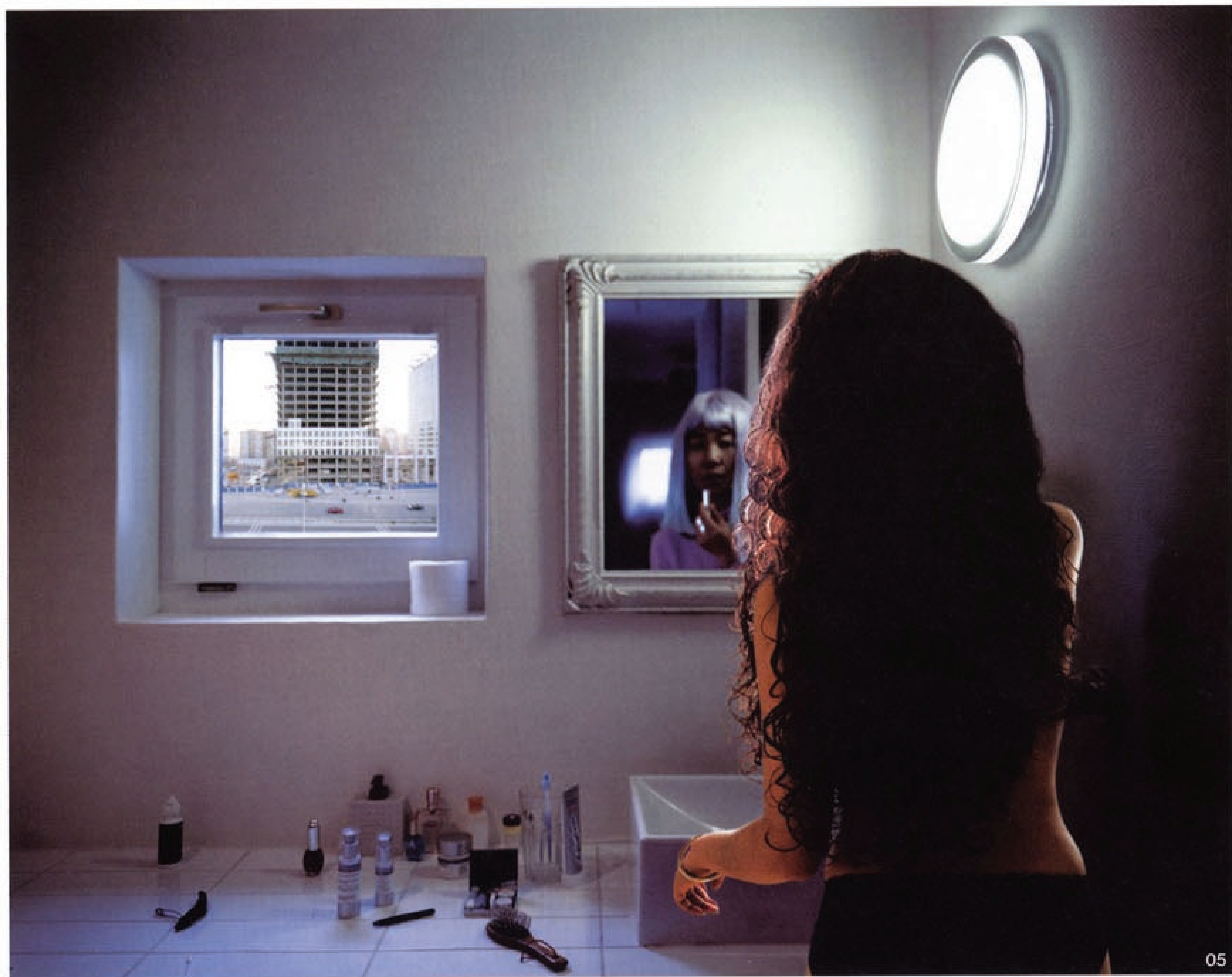
04 邢丹文 Wall House 摄影 1200X1600mm 打印材质: EPSON Display Trans 灯箱片 2007 05 邢丹文 Wall House 摄影 800X1000mm 打印材质: EPSON Display Trans 灯箱片 2007