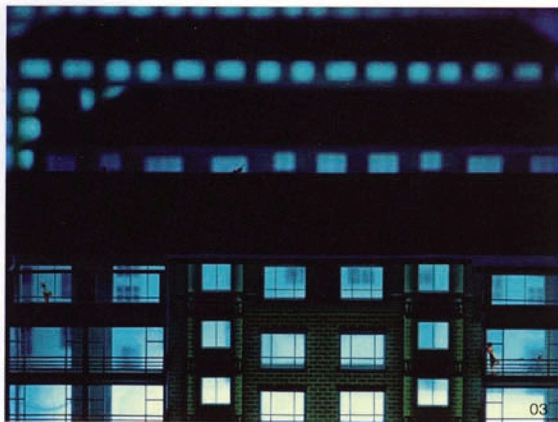
01 邢丹文 Wall House 摄影 90X120cm 打印材质: EPSON Display Trans 灯箱片 2007 02 邢丹文 都市演绎 摄影 80X114cm 打印材质: EPSON 高质量亚光照片纸 270克 2009 03 邢丹文 都市演绎 摄影 80X105.5cm 打印材质: EPSON 高质量亚光照片纸 270克 2006

作为一个在国际上活跃非常的中国艺术家，邢丹文的艺术实践，频繁涉及现代女性的命运与困境。