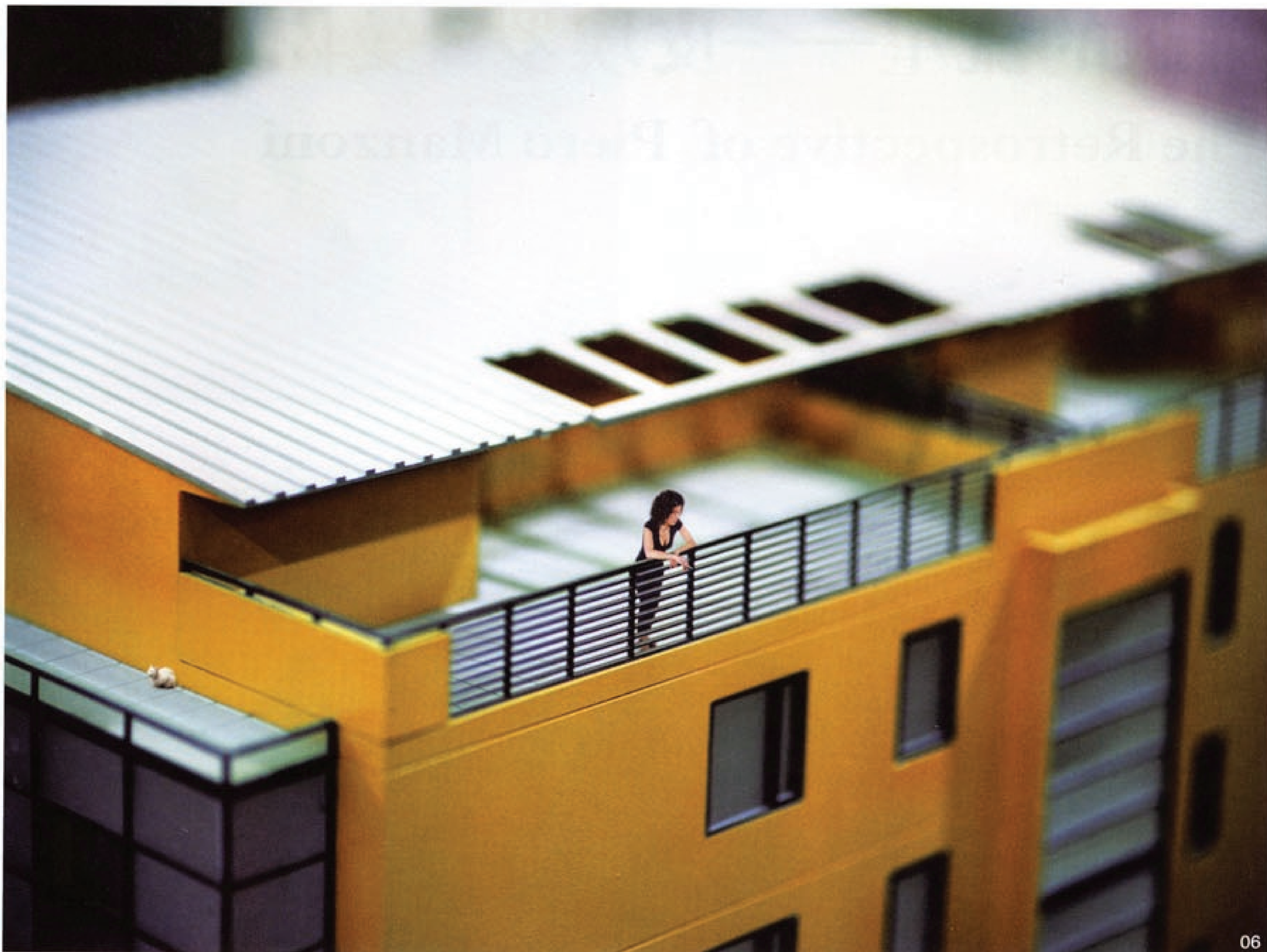
06 邢丹文 都市演绎 摄影 150X188cm 打印材质：EPSON 高质量亚光照片纸 270 克 2004

在当今中国，运用摄影作为表现手段显然已经成为一种时髦。而且，也确实有许多机灵的艺术家用准时机，在对于摄影一无所知的情况下因大胆运用摄影手段而一举成名。然而，邢丹文的摄影经历，从一开始就向我们证明，她是出于一种对于摄影本身的深厚兴趣与严肃的态度来展开自己的艺术实践的。她充分认识到了摄影所具有的丰富潜能，并且全身心地投入到开发摄影表现潜能的工作中去。从1989年起开始拿起照相机的邢丹文，在与她身处其中的中国当代社会现实展开对话的过程中，同时也与摄影这个现代视觉媒介展开了对话。随着中国的变化与发展，摄影以及影像在现实生活中的扮演的角色越来越多样化，也越来越复杂。这种复杂性与丰富性，也正好从她的艺术经历中得到印证。纵观邢丹文的艺术经历，可以发现，这几乎就是一个人与一种媒介在中国社会的发展变化中共同成长的历程。她以她的持续的、可靠的专业经历证明，人们可以从她的专业经历的轨迹，清楚地发现摄影这个现代性的媒介在一个当代艺术家手中如何获得当代意义。与此同时，摄影这个媒介在当代中国的生长与发育，也通过她的实践而具有了一种个案意义。她通过自己的实践，证明了摄影在当代中国的存在价值。而作为一个在国际舞台上非常活跃的艺术家用，她的摄影实践也一直在丰富着中国摄影在世界上的形象。