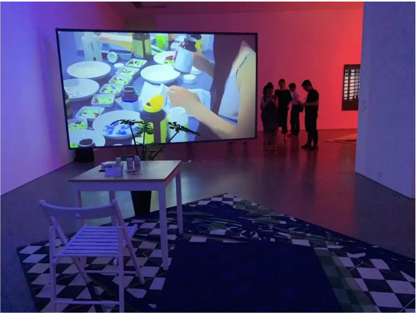
《生命处方》展览现场