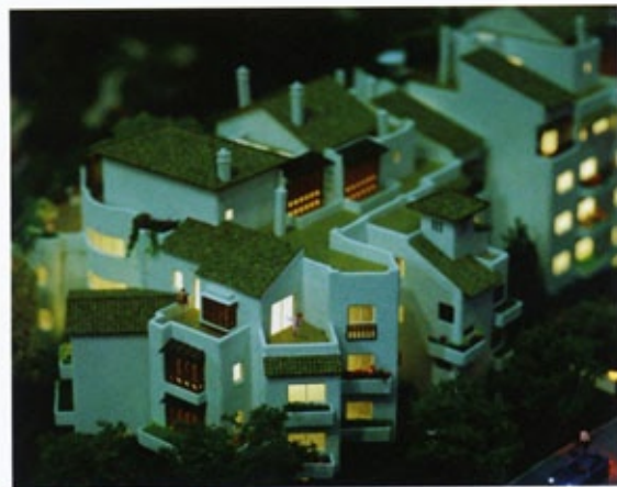
邢丹文 | 都市演繹系列圖23 Urban Fiction, image 23 212.5x170cm 2005