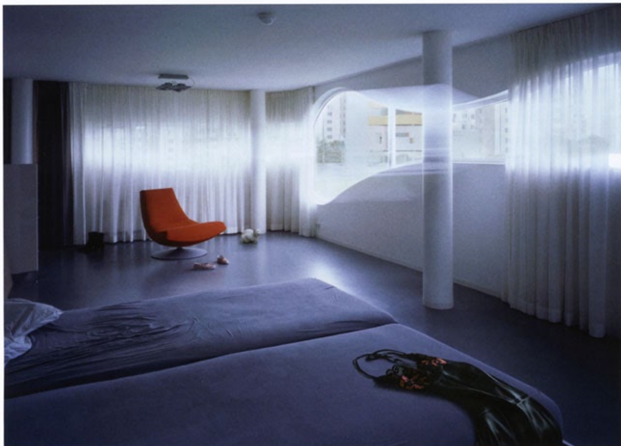
邢丹文 | Wall House系列圖3 130x100cm 2007