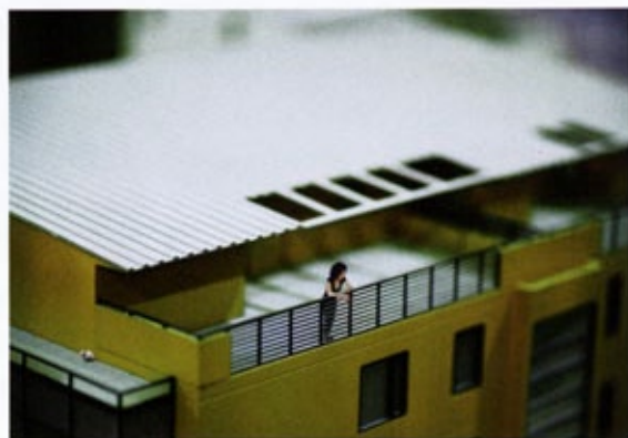
邢丹文 | 都市演繹系列圖9 Urban Fiction, image 9 213.2x170cm 2004