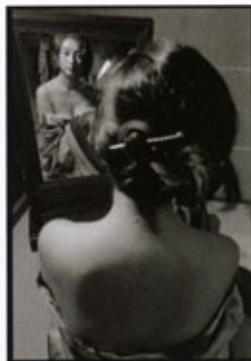
邢丹文 | 我是女人系列圖6 1994-1996

一直以來，女性身體的視覺呈現始終處於男性視線的掌握之中，邢丹文的《我是女人》卻斷然拒絕了女性身體表現中男性獨霸的局面，這件作品可以說是中國攝影史上最早由女性拍攝的人體攝影作品之一。就像題目所主張的，此作體現了強烈女性自我意識的確立。在一個封閉的空間裡，邢丹文以私密的視線、豐富多變的視角、詭譎的光影和相互纏繞的女性肢體，建立起一個不容他人染指的女性私空間。這個空間中的一切，只有在女性之間的相互依賴與信任狀態下才能拍攝到。而其中一張女性對鏡照片，令人想起聞一多曾經為潘光旦的心理分析小說《馮小青》畫過一幅《對鏡》。在聞一多的作品中，小青顧影自憐的形象透過鏡子映現出來：她通過鏡子觀看自身，但在她的背後，存在著另一個觀者的眼睛。在這裡，想像女性與建構女性形象成了男性的特權，也成為觀看與呈現的原動力；而在邢丹文的這組作品裡，同樣有一張女性對鏡圖，但此時是女性觀看女性，女性定義女性的感情與身體。通過對於女性身體的觀照，邢丹文第一次為新女性的存在與主張賦予具體型態。如果說她的藝術家影像標誌了攝影自我的覺醒，那麼女性人體影像則顯現了她女性自我的確立。