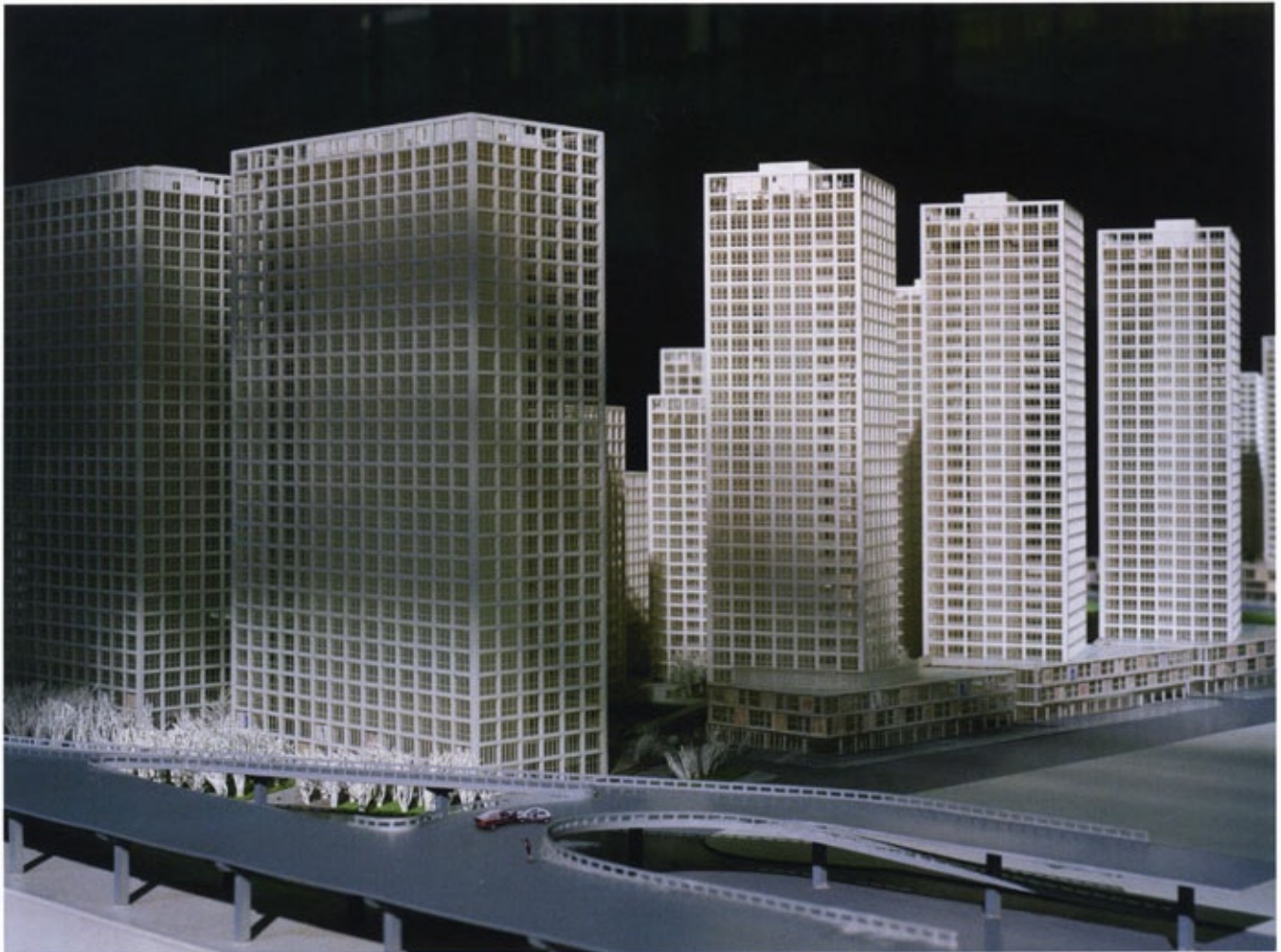
邢丹文 | 都市演繹系列圖3 Urban Fiction, image 3 224.3x170cm 2005