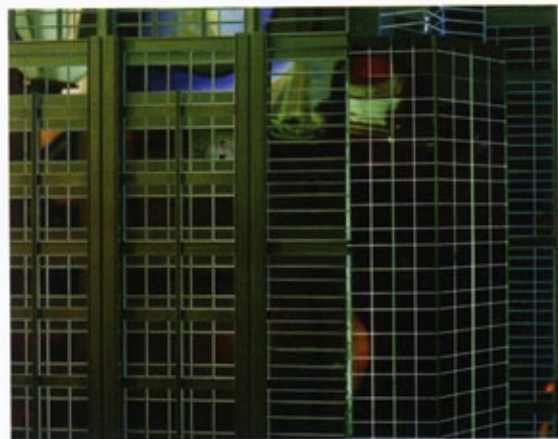
邢丹文 | 都市演繹系列圖7 Urban Fiction, image 7 213.3x170cm 2004

己的藝術實踐。她體悟攝影的潛能，並且全身心地投入於這種潛能的開發。她以她持續的、可靠的、無可替代的專業經歷證明，人們可以從她專業經歷的軌跡，清楚地發現攝影這個現代性媒介如何在她手中獲得當代意義、中國的現實又是如何通過她的攝影顯影。與此同時，攝影這個媒介在當代中國的生長與發育，也通過她的實踐而具有一種個案意義。她通過自己優秀的實踐，同時提升了攝影在中國的地位，證明了攝影的存在價值。然而，她也並沒有為攝影所困、固守攝影，而是從其他媒介的實踐來豐富、發現攝影的其他可能性。其非常優秀的錄像作品，雖然不是本文的範圍，但顯然不能與她的攝影實踐割裂開來對待。