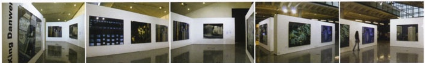
邢丹文「都市演繹」展覽現場。