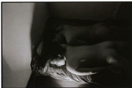
邢丹文 | 我是女人系列圖13 1994-1996