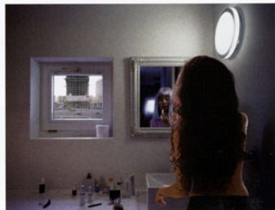
邢丹文 | Wall House系列圖2 100x80cm 2007